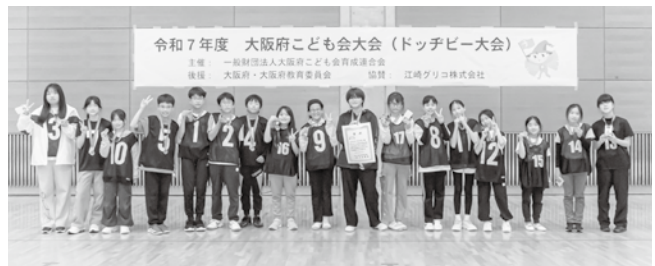
高学年チーム「大きいとよのん」