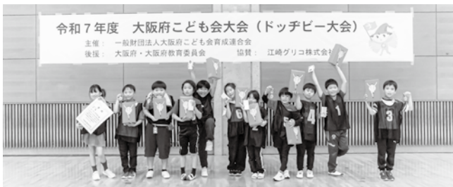
低学年チーム「小さいとよのん」