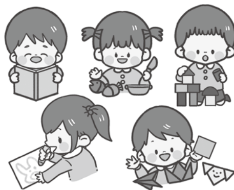
こども園の民営化と無償化を

問 昨年12月議会でもども園を民営化すれば、1億1200万円の費用が圧縮できる。またゼロ歳児から2歳児の保育料を無償化するためには、1620万円の財源が必要であると答弁があった。東京都では、昨年9月にゼロ歳児から2歳児までの保育料を無償化している。2月には大阪市でも無償化実施に前向きなTV放映された。