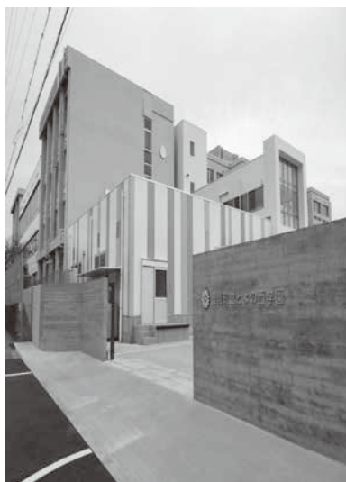
4月に開校することよの西学園

舎内の教室の一部を利用する。ことよの東学園は以前から利用の施設となる。ことよの東学園でも校舎内の教室の一部を利用できないのか。