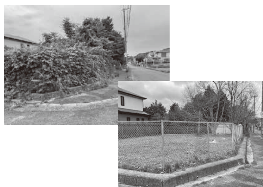
再発防止に向けた条例制定を

問 老朽化した公共施設を現状維持・更新した場合に見込まれる維持管理費と比較し、起債を活用した施設の統廃合・集約化は、中長期の財政負担がどの程度軽減されるのか。 答 公共施設を現状維持した整備費用は、維持修繕したものを除いて、年間約9.6億円となりま