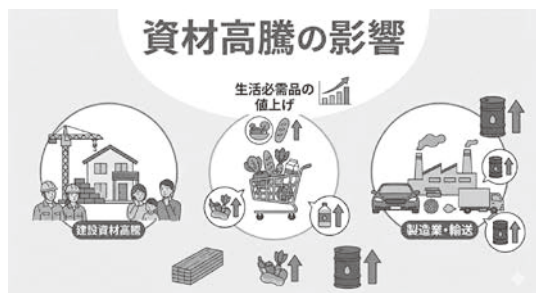
止まらない資材高騰の波