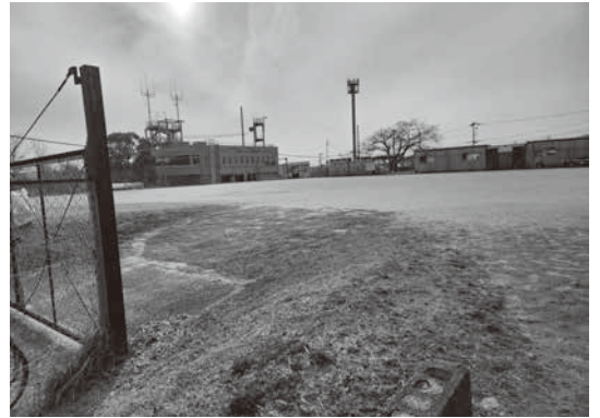
ふれあい広場の活用を

問 豊能町は、国の法律に基づいて災害直接犠牲者の遺族に最大500万円の弔慰金を支給する条例を制定している。 しかし、避難先で過労や強いストレス、持病の悪化や病気発症などによって死亡した場合、災害関連死か、どうか判断する認定審査会を設置していない。一年前、万が一に備えて、早急に設置するよう求めた。