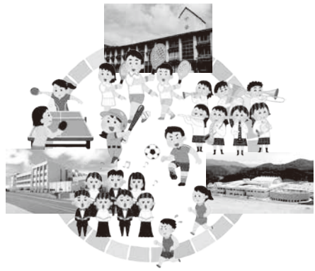
3校で一緒にクラブ活動を

の協議を含めて、考えていきたいと思っています。 問 近隣のどつろみの森学園と、とよの東学園、西学園、3校の部活動の場を一緒にすることはできないのか。 答 どつろみの森学園は、みのお地域クラブ活動という形で実施して、どつろみの森学園を活動場所としている団体も複数あり、とよの東学園、西学園との間にちょうど挟まれる形での地理的な要因も生かして、今後箕面市とは協議をしたいと考えます。