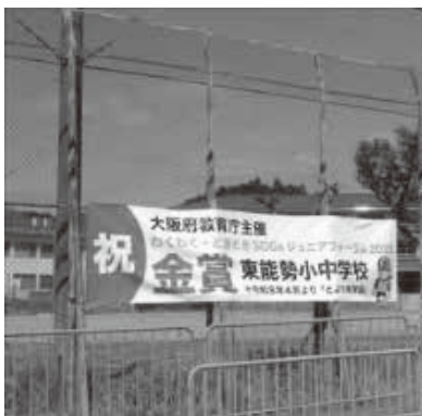
横断幕は現場で既に準備が進んでいた