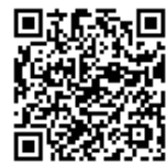
二次元コードはこちら

※二次元コード読み取りの上、LINE公式アカウントに友だち登録してご利用ください。