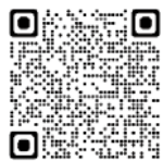
ホームページはこちら