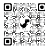
特設ページはこちら

気象庁ホームページ内の特設ページでは、新たな防災気象情報に関するさまざまな資料を掲載しています。これらの資料を参考に、情報が発表された際にどのような行動をとるか、ご家庭や職場・組織内であらかじめ決めていただくようお願いします。