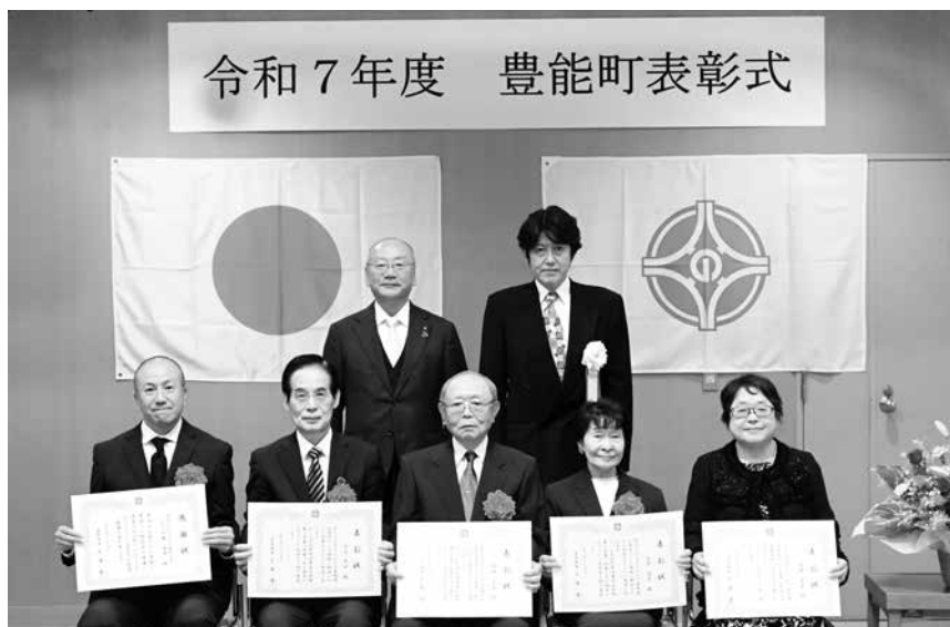
写真後列左から、 上浦町長、永並議長