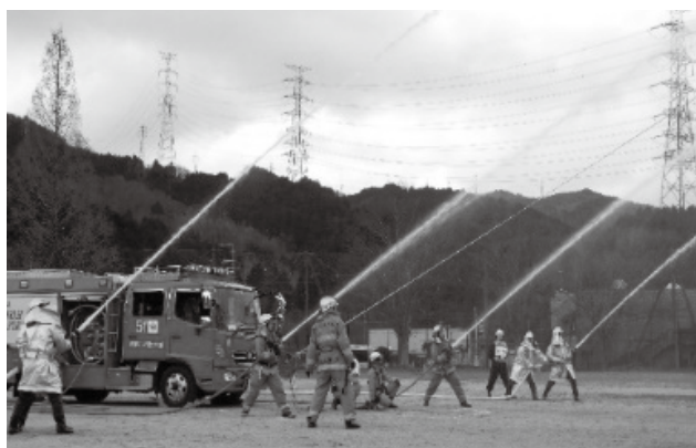
消防職・団員による一斉放水の様子

新春の初頭に際し、町消防団員および豊能消防署員が一堂に会し、防火・防災に対する決意を新たにするとともに、この一年が平穏で安全安心なまちであることを願って、一斉放水訓練を行います。