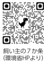
飼い主の7か条

また、動物の虐待・遺棄は犯罪です。正当な理由なく動物を殺傷することや、必要な世話を怠るネグレクト、毒入り餌の公共の場所への放置などは、動物愛護法違反の罪に問われることになります。