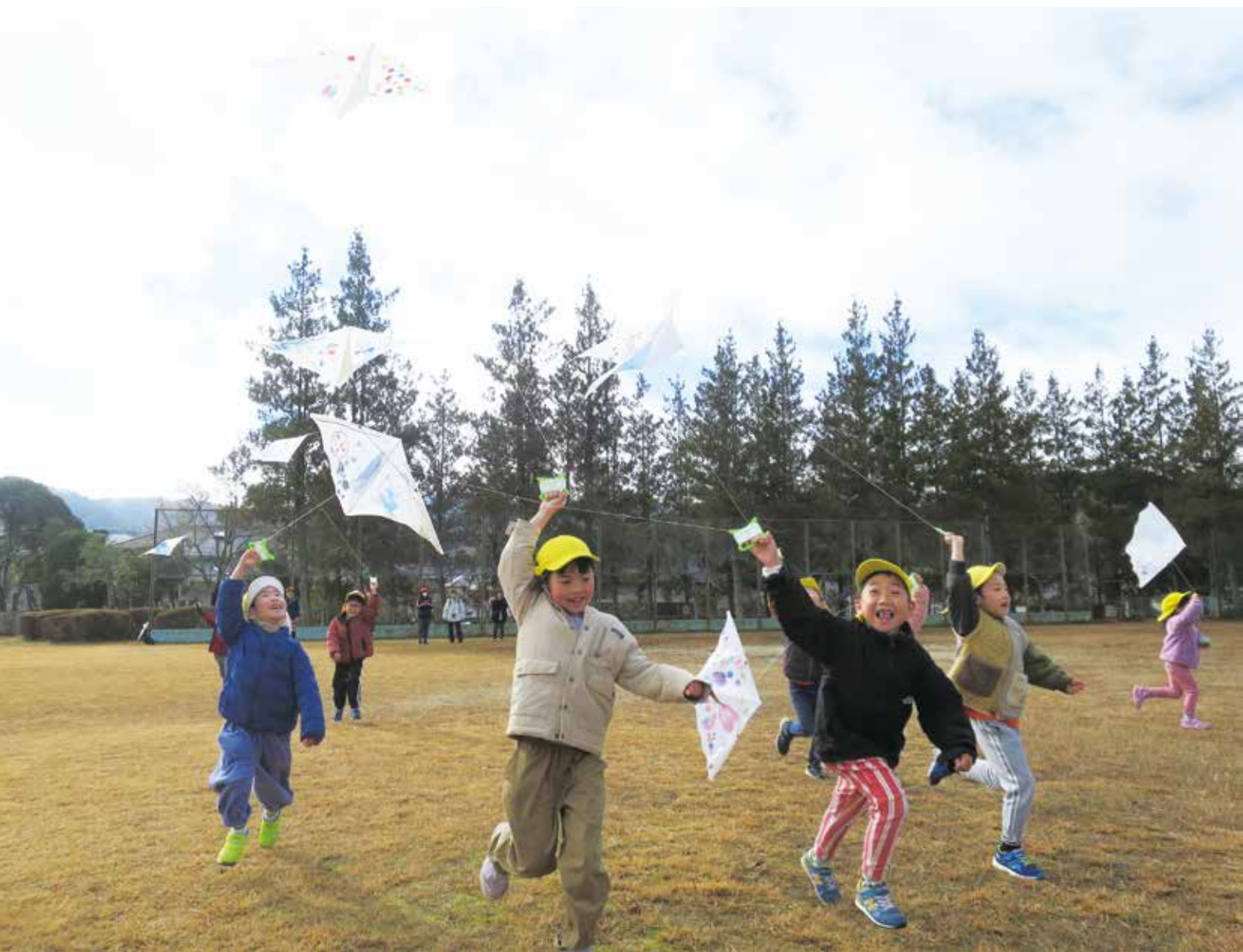
ふたば園園児による凧あげ (希望ヶ丘中央公園にて)