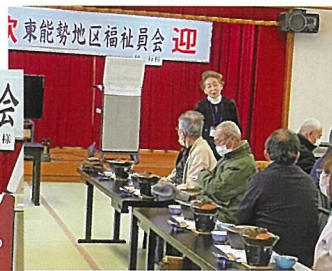
福祉委員会 会長挨拶