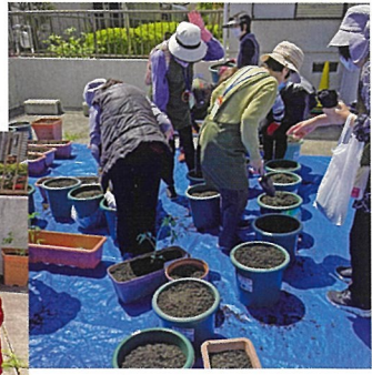
私の鉢はどれやったかな～

5月2日福祉委員会で55名の参加者と一緒に青空の下、夏野菜ミニトマト「アイコ」の植え付けをしました