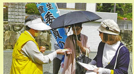
吉川・ときわ台 4丁目付近