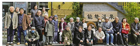
また一つ思い出が増えました

春のさざしを感じながら曲がりくねった山道を抜けると、あっといつ間に到着。能勢の自然豊かな景色を見渡せる会場で、色とりどりのお料理とお喋りをゆつくりと楽しんだ後、道の駅でお買い物も楽しめました。参加者の方から「普段一人だから、おしゃべりしながらいただくご飯はやっぱり格別」今日は誘ってくれてありがとうございました。