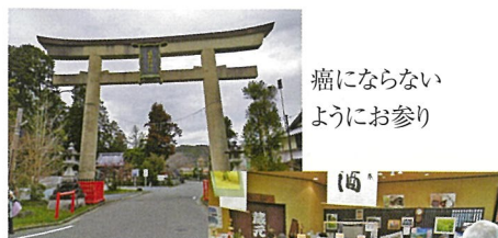
癌にならないようにお参り