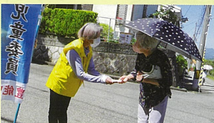
東ときわ台 祥雲館ヴィレッジ前