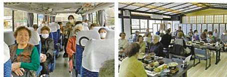
帰り道も笑顔いっぱい