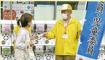
東能勢 余野ファミリーマート前

今年も地域の皆さんに民生委員・児童委員の活動をPRするためにウェットティッシュを配りました。