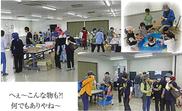
へえ～こんな物も!? 何でもありやね～

5月18日福祉委員会主催「能登半島地震義援金バザー」を自治会館で開催。バザー物品は東ときわ台中心に各地区から多数の提供があり会場いっぱい、当日も大勢の方々に来場していただき予想以上の反響がありました。この売上金は社会福祉協議会を通じて能登半島地震義援金として送らせていただきます。