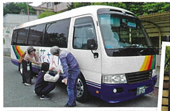
今年芳泉文化財団からの助成金でループバスが実現

おさんぽクイズは8カ所に散りばめられた問題の答えの字を並べ替え、ワードを組み立てると言つもので、正解してラッキーさんに花丸🌸をもらえた人はごく僅かだったとか。来年はみんなでチャレンジしてみよう！