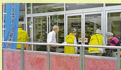
光風台 デイリーカナート前