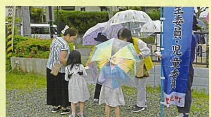
新光風台 自治会館前