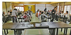
皆で食べると楽しいですね

神社を参拝して各自ゆつくりと過ごされました。帰りのバスの中ではおしゃべりに花が咲きとても楽しい一日になりました。