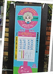
手づくりのバス停