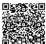
ホームページはこちら