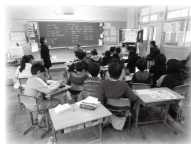
オンラインでの発表(小学生)

2月19日にオンラインによるポスターセッションが行われました。府内11校の小学生がポスターなどで表現した「すべてのいのちが輝くアイデア」について、他校の児童と発表し合い、SDGs への意識を互いに高めました。東能勢小学校5年生は「わたしたちの地元活用」をテーマに、豊能町で販売されている「かあちゃんみそ」や「猪すじ肉カレー」を紹介し、地産地消には4つのメリット（①安い②新鮮③旬④地域に貢献できる）があることを伝えていました。