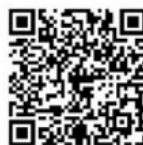
ホームページはこちら