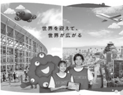
会場内での案内もまちなかでのおもてなしも