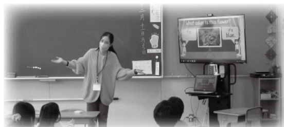
「この花は何色?」としかけるアビーさん

学校の授業だけでなく、11月12日に開催された町立図書館での英語の絵本の読み聞かせにもご協力いただきました。