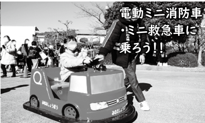
電動ミニ消防車・ミニ救急車に乗ろう!!