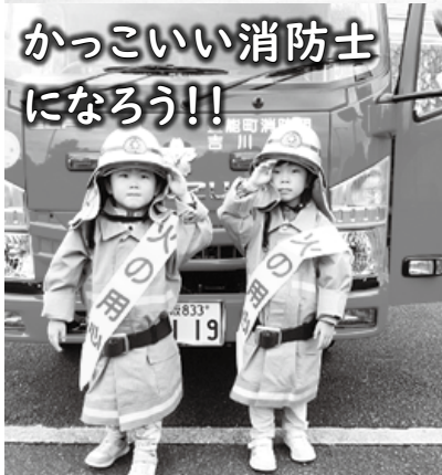
カッコいい消防士になろう!!