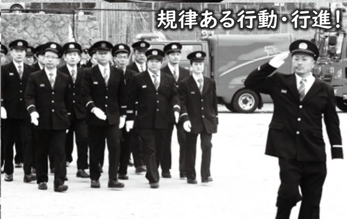
規律ある行動・行進!