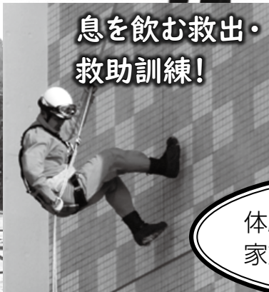
息を飲む救出・救助訓練!