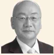
町長 上浦 登

11月に入りますと、暦の上では、立冬の頃で冬の気配を感じる季節とされています。本町でも、木々が色づき始め、日ごとに秋の深まりを感じる季節となりました。さて、10月下旬から、町の抱える課題につきまして住民の皆さんにご説明しご意見をお伺いするため、町政懇談会を開催しています。