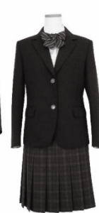
II型 ・ブレザー ・スカート