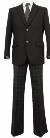
I型 ・ブレザー ・ストレート スラックス