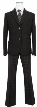
II型 ・ブレザー ・丸みを帯びた スラックス