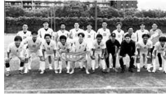
北摂ユナイテッド集合写真