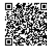
大阪府のホームページ