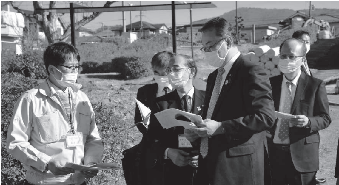
光風台中央公園の視察の様子

本町のスマートシティの取り組みである「コンパクトスマートシティパーク」の取り組み拠点となっている「子育てひろば だんでらいおん」や、IoTを活用した光風台中央公園整備を視察されました。