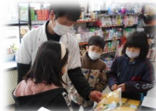
「ハンカチありませんか」