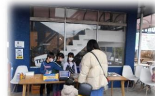
「バイクの部品のサビで染めました」