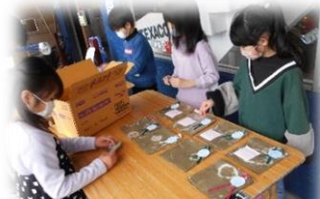
開店に向けて準備

いきいきとした子どもたちの姿が、貴重な体験となったことを物語っていました。豊能町では、探究的な見方・考え方を働かせ、具体的な活動や体験、横断的・総合的な学習を行うことをとおして、「とよの」への理解を深めるとともに、自己の生き方を考えるための資質・能力の育成をめざす「とよの未来科」を推進しており、このような活動を積極的に取り組んでいきます。