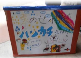
自分たちで作った看板