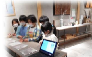
「自分たちで染めたハンカチです」