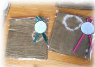
ていねいにラッピングされたハンカチ