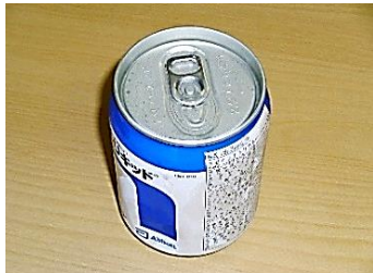
経腸栄養剤のカン など