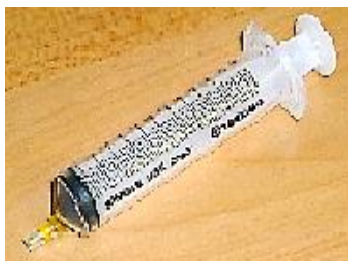
注射器（本体）・ カテーテルチップ