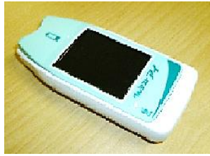
血糖値測定器（本体） など