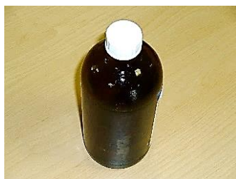
ガラス製の薬ビン など