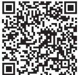
豊能町立図書館 9月のおはなし会