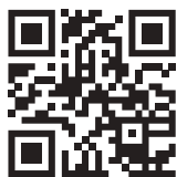
シートスホームページ