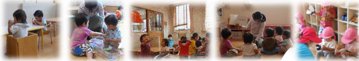
コップで牛乳を飲みます

子どもたちが、やりたいと思ったことや好きなことを大人にまるごと受け止めてもらえる。この経験が、生きていくための芯となる力を育み、「豊かな子ども」を育てることにつながるのだと感じました。