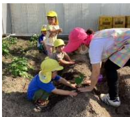
うさぎ組が苗を植え、りす組が水やりをしましたよ。