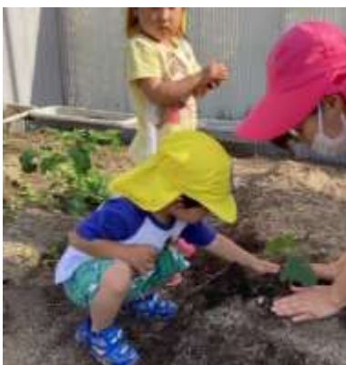
キュウリを植えました。