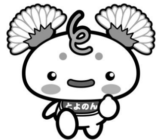
豊能町イメージキャラクターとよのん

この地域公共交通会議で施策評価を行いながら基本構想を推進することで、住民、交通事業者、行政が協力して利便性の高い公共交通の構築を目指します。