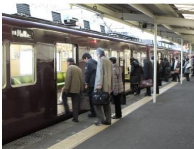
朝の能勢電鉄光風台駅