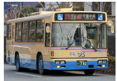
阪急バス北大阪オボリス線