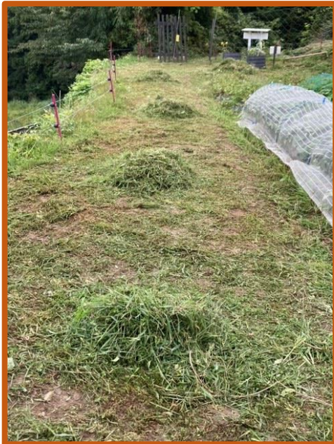
こんなにすっきりしました！

電柵やネットを張っているのですが、侵入者も賢くて、入るところを知っているのでしょうか。。侵入者は鹿の親子のようでした。野生動物も食べ物探しに必死です。