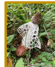
こんな不思議なキノコが生えていました！