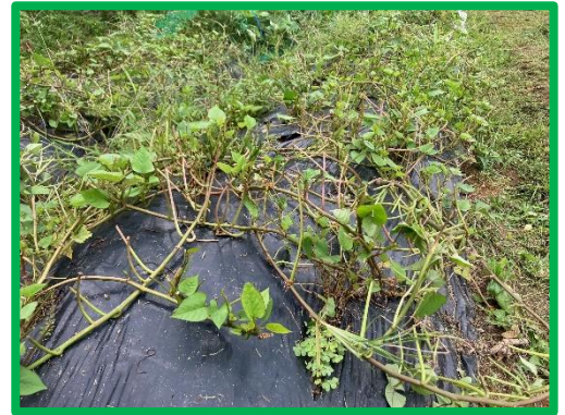
サツマイモの新芽が少し食べられました