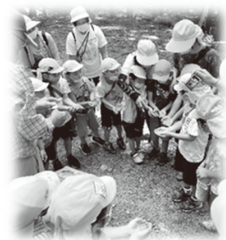
「ぼくの手にもわせて!」