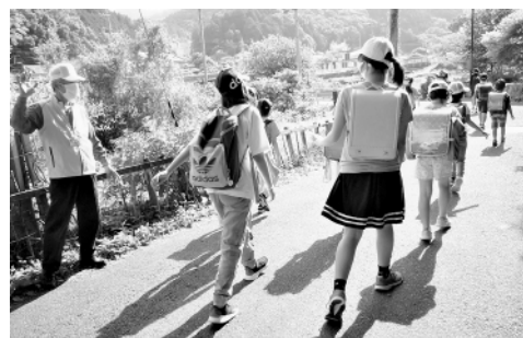
行ってらっしゃい！ がんばってね！

地区の民生委員・児童委員は、高齢者から子どもたちまでみなさんに安心して暮らしていただくため、日頃からさりげない見守りをしています。