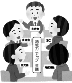
ワイワイ意見が飛び交って

このため、昨年度より自治会・福祉委員会・SC東ときわ台（福寿会）と地区民児協の4団体が代表者会議をスタートさせました。意見交換はじめ情報共有のシステムを作り、活動内容を自治会ホームページ・広報誌などで発信。