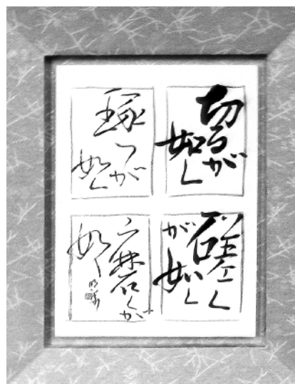
きるがごとく、みがくがごとく、 うつがごとく、みがくがごとく