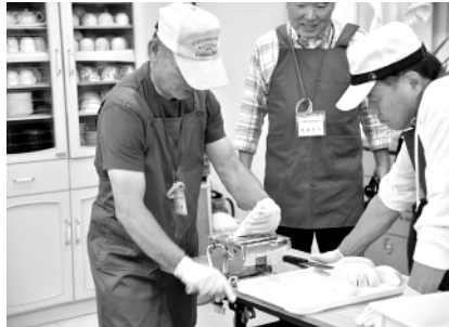
うどん: 麺作りから盛り付けまでみんなで作ればなんとおいしい!

また、「ごみ分別について」「スマホ活用教室」などの勉強会は、大変参考になったと喜ばれました。