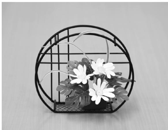
ソフト粘土「マーガレット」 高さ 18cm