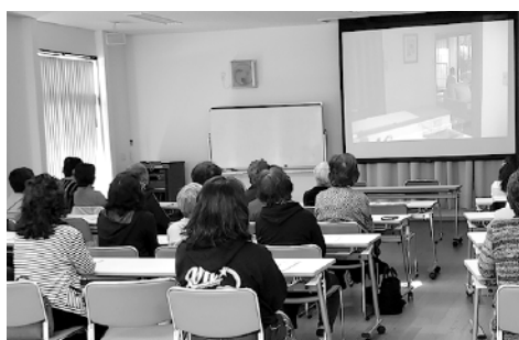
みなさん真剣な面持ちで画面に見入っておられました

第1回DVD「二本の傘」 第2回DVD「認知症とその世界」 第3回記録映画「ボケますからよろしくお願いします」 平均40人の参加者があり「大変参考になりました」「また企画してください」と喜ばれました。 若い世代にも知って頂くため、今後も続けていきます。