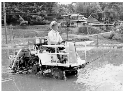
田植機も私もまだまだ現役！ おいしいお米を作っています

東能勢地区 「安心生活見守り台帳 登録のおすすめ」 木代地区では、老人会総会に出席し、「安心生活見守り台帳」について詳しい説明をさせてもらっています。その後、75才以上のひとり暮らしの方、昼間おひとりの世帯に伺って登録をお勧めします。 世間話で話が弾むこともあります。 地域のみなさまの、身近な相談相手になれるよう活動しています。