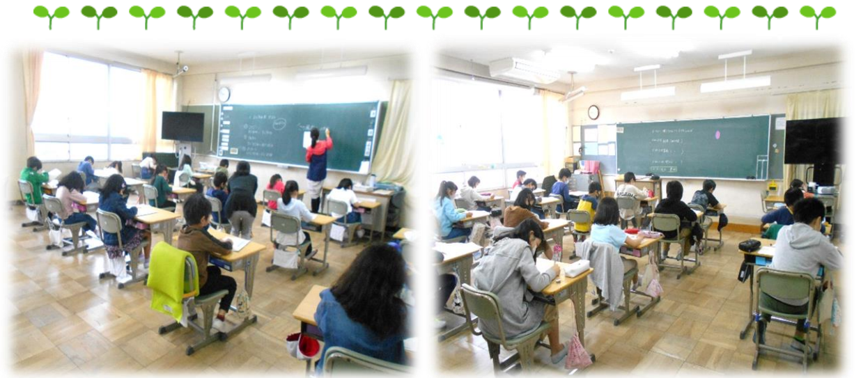
子どもたちは、粘り強く問題に取り組んでいました。【光風台小学校の様子】

http://www.town.toyono.osaka.jp/page/page004516.html