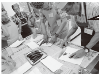
鰯の手開きに挑戦！