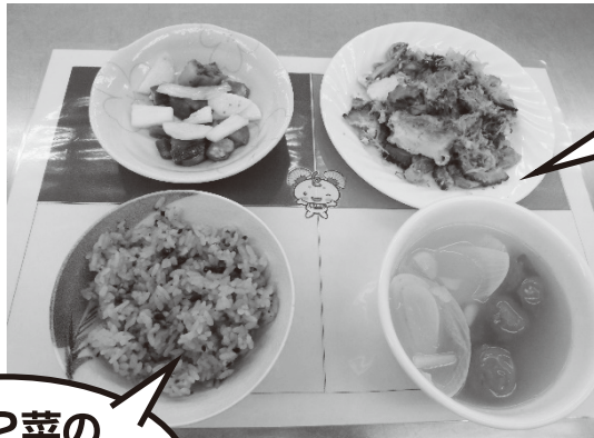
栄養バランスのとれた食事が完成♡ お味も good!