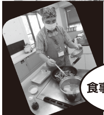
1汁2菜の食事が作れるようになります