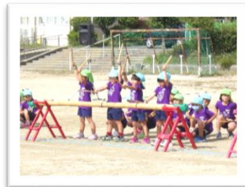
10月11日 ひかり幼稚園

地域の皆様、保護者の皆様には、子どもたちが当日気持ちよく迎えられるよう、様々な面でサポートいただきありがとうございました。