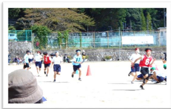
10月1日 東能勢中学校