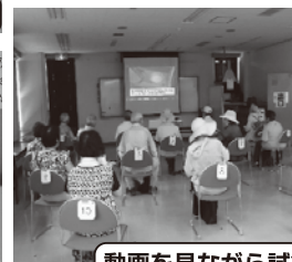
動画を見ながら試食