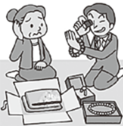
(消費者庁 イラスト集より)

・訪問した業者に貴金属等を買取られる「訪問購入」に関する相談が寄せられています。 契約書面を受け取った日を含む8日間、クーリング・オフ(消費者が無条件で契約を解除できる制度)ができます。消費者は返金して売却した物品を返してもらいます。また、クーリング・