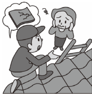
(消費者庁 イラスト集)