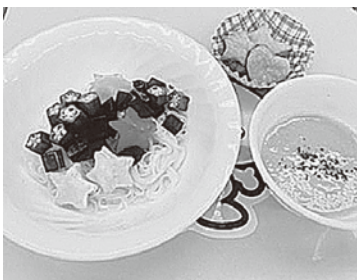
6月は「七塔」をイメージした献立です。(写真)

¥11組200円(親1人・子1人) 子ども2人目から1人につき100円 持 筆記用具・エプロン・三角巾・手拭きタオル・ふきん・お茶・スプーン・フォーク・お箸・上靴(親・子とも)、ランチョンマット(親のみ) 員 16組(申し込み順) 受付開始 6月3日(月) 申・問 健康増進課(保健福祉センター) ☎7360-2001