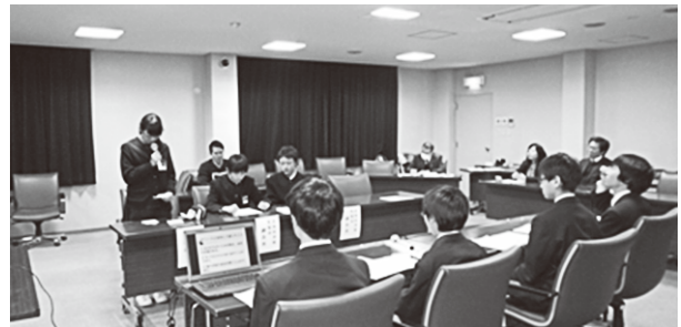
各校の発表（吉川中学校）