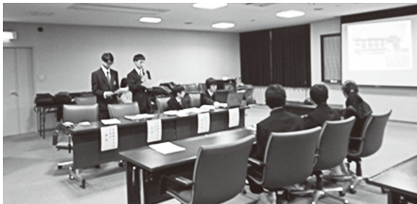
各校の発表（東能勢中学校）

最初の自己紹介では、お互い緊張した面持ちでしたが、発表や話し合いを通して少しずつ打ち解け、真剣に意見を出し合う中にも、笑顔で盛りあがる姿が見られました。また、どの生徒も丁寧な言葉遣いで、運営・発表など生徒が主体的に行い、頼もしく映りました。今年度は東能勢小学校の児童会役員2名が交流会の見学に来られ、中学生の話し合った内容を学校へ持ち帰りました。今後の児童会・生徒会活動につながる非常に有意義な生徒会交流会となりました。