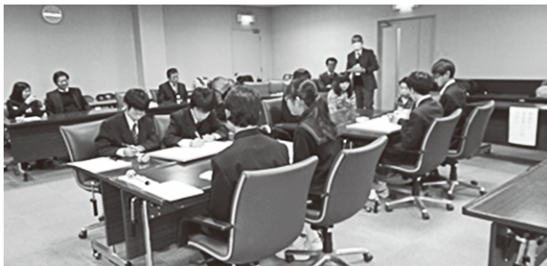
グループディスカッションの様子