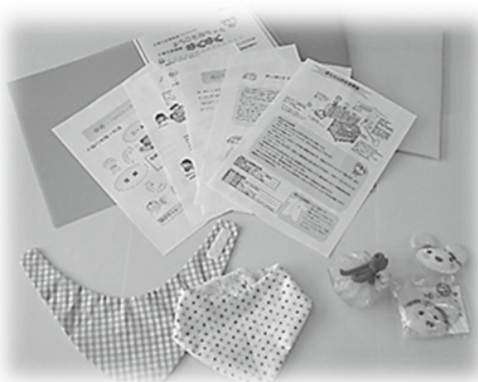
訪問時に届ける情報やおもちゃ等

平成26年より、子育て支援プロジェクトとして、妊娠から出産・育児までの切れ目のない子育て支援を充実するため、保健福祉センターの保健師と地域子育て支援センターすきっぷの保育士が連携を図り、生後4カ月までの赤ちゃんとその家庭を8回程度訪問しています。産後ケアを含め赤ちゃんに必要な知って良かった情報や地域のボランティアさんの手作りおもちゃのプレゼントもあります。助産師による母乳ケアや産後ママの相談、ベビーマッサージも行っています。