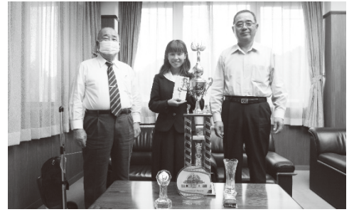
(左から) 池田町長、荒木さん、乾副町長