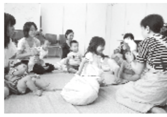
おはなしのたまご