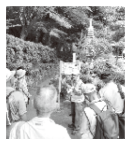
豊能の歴史と自然