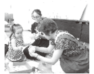
「とまと」の活動風景