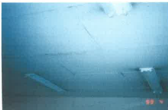
天井のスレート板

(問い合わせ) 池田市環境部広域環境保全課 (池田市環境部環境政策課内) 直通：072-754-6647 代表：072-752-1111 (内線 465)