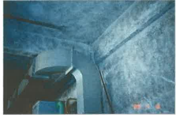
機械室の壁・天井の断熱