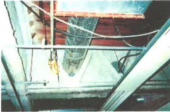
鉄骨造の梁・柱の耐火被覆