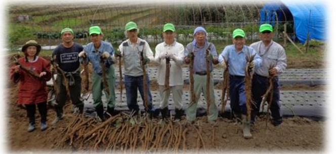
ゴボウを手に、笑顔も一等賞

棚田の気温は3℃…霜が降りだす。高山の冬は一足速くやってくる。収穫を終えた農家は、五穀豊穡の感謝と来年の豊作を願って、秋祭り。…山々が黄葉しだすと、あわただしく冬の足音とともに冬仕度が…「冬至十日前」、生活面でも最も日が短く感じる。