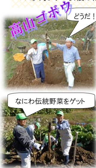
なにわ伝統野菜をゲット

「農のふるさと協力隊」も、少しの間、冬籠り！。今年も豊穡の大地から恵みを戴いた。ゴボウ・ヤーコン・ピーマン・サツマイモ・クワイ等、また可愛いゲスト(園児)を迎え、棚田の収穫を体験できた。活動に手ごたえのある毎日であった。何よりの収穫は隊の仲間が無事故・ケガ無く過ごせたことである。