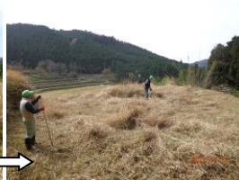
コンニャクを栽培