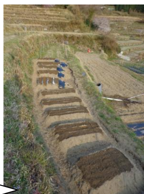
高山ゴボウの播種、「波板栽培」と「高畦栽培」さて… 4/14