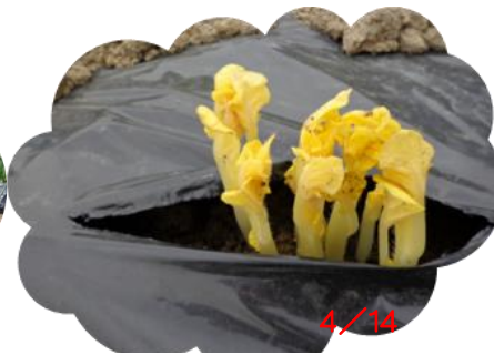
なんだこれは！突然変異か！ マルチから出たばかりの「ジャガイモの芽」 4/14