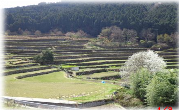
棚田に春を告げる"タムシバ"が咲く。農作業の開始を知らせてくれる。 4/3