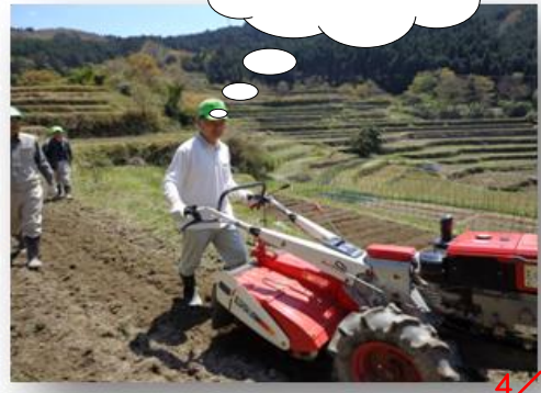
棚田での汗が明日のパワー源 4/3