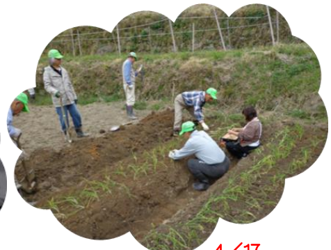
地元の人からもらった「九条ネギの苗」の植え付け中。七月頃に干しネギにし、再度植え付け収穫(10月頃) 4/17