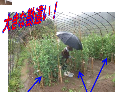
スナックエンドウ

収穫にワクワク気分。絹さやエンドウだと…思い込み、実エンドウを収穫。大失敗でした。来年は…気をつけたい。