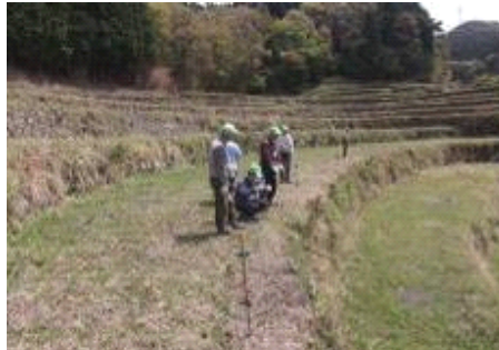
只今、下から三枚目に電柵を設置中。イノシシとの知恵比べがつづく

【5月4日（水）】 大型連休のド真ん中。まずまずの天気。朝の静寂を破る草刈り機のエンジン音が、山あいにごだます。今日は周囲の情趣を楽しむ暇もなし…。夏野菜の植付前の大切な作業「電柵張り」である。まずは電柵を張る前の下草刈り…初めて機械を手にする人もあり、…簡単な取扱説明をする。あとは使って慣れるのみ。理屈より体験が一番。（9名参加）