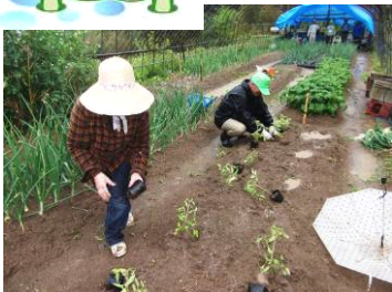
雨も適度の湿り具合！元気に夏野菜の植え付けが進む…

収穫にワクワク気分。絹さやエンドウだと…思い込み、実エンドウを収穫。大失敗でした。来年は…気をつけたい。