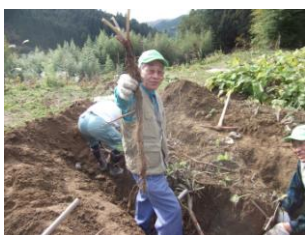
大地からの恵みに大満足

11月27日(日) いよいよゴボウ掘りの到来！ 真剣勝負で息を抜き、優しく引き抜く。力を入れすぎると途中で…ポキ。ゴボウの価値が下がる！スコップ・つるはしで70cmほど掘り込む。高山ゴボウはたかがゴボウではない事を実感しました。納得できる体験に、歓喜。(参加者:15名)