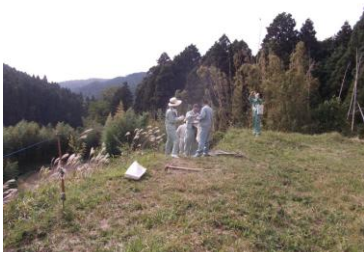
大阪府、高槻市より視察

全山紅葉の一步前。青く高い空に思わず深呼吸。秋本番。 「あの道 この道 迷い道」どこかで聞いた言葉だが、棚田への道も加えたい…。 なんでもないあぜ道・山裾に小さな発見が、ビナンカズラ、リュウノウギク…草花の目の高さで見るととてもかわいい。そんな素顔に出逢えるのも魅力のひとつ。今日も自然のふところの中にとっぷりつかっています。