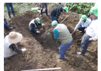
掘り始めて一時間経過、凄い！お宝発見！！

11月27日(日) いよいよゴボウ掘りの到来！ 真剣勝負で息を抜き、優しく引き抜く。力を入れすぎると途中で…ポキ。ゴボウの価値が下がる！スコップ・つるはしで70cmほど掘り込む。高山ゴボウはたかがゴボウではない事を実感しました。納得できる体験に、歓喜。(参加者:15名)