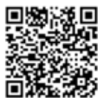
おおさか防災ネット QRコード

( http://www.cds.osaka-bousai.net/mobile/pref/MobileWarningJmaDetail.html )