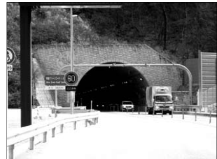
止々呂美料金所付近