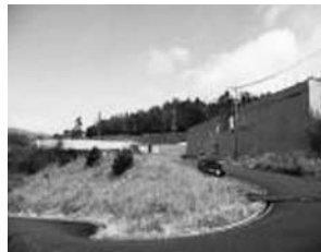
美化センター (H24.3.12 現在)

周辺地域の方々には、長期間の作業に対しご理解ご協力いただき、ありがとうございました。