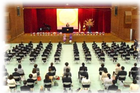
「吉川中学校入学式」 新入生代表が、立派に抱負を述べました。