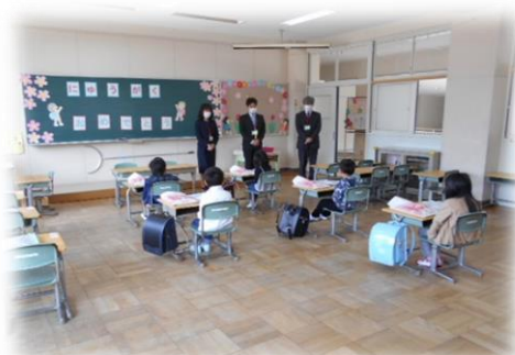
「東能勢小学校新1年生」 窓の開けられた教室で、担任の先生から教科書が配布されました。

桜の花が満開のなか、4月7日、中学校の入学式が規模を縮小して開催されました。しかし、国の「緊急事態宣言」発令に伴い、小学校・幼稚園の入学・入園式、小中学校の始業式は延期することとなりました。登校・登園を楽しみにし、心待ちにされていた皆さんには、大変申し訳ないことになりました。子ども達のにぎやかな声が、学校に一日も早く戻ってくることを願います。