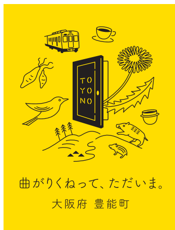
黄色との組み合わせ

ロゴは、基本黒色1色を推奨します (K:100)。カラーバリエーション例は下記参照ください。(背景が濃い色の場合は白で配置ください)