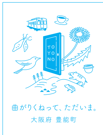
青色との組み合わせ