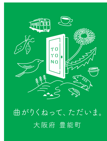
緑色との組み合わせ