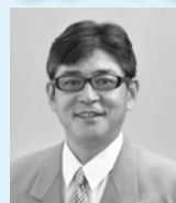
町長 田中 龍一

5月に入り、木々の緑が眩しく感じられる季節となってまいりました。暦の上でも、これから立夏を迎え、夏の気配が感じられる頃とされており、皆さんも行楽に出かけられる機会が増えてくることと思います。