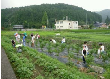
旧高山小学校活用事業(提案事業) 夏野菜収穫体験とそうめん流し